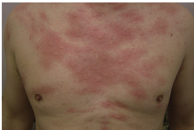
Figure 1. Plaques d'urticaire sur le décolleté apparaissant moins d'une heure après exposition solaire.

est assez fréquente. En cas d'exposition prolongée, les lésions sont profuses et peuvent être associées à des signes généraux : céphalées, vertiges, nausées, bronchospasme, malaise et exceptionnellement choc anaphylactique. Après l'éruption, il existe une période réfractaire de 24 heures en moyenne pendant laquelle une nouvelle exposition n'entraînera pas de nouvelle poussée. Certaines radiations comme les UVA peuvent traverser les vêtements légers et déclencher des lésions sur les territoires apparemment couverts rendant le diagnostic plus difficile [4].