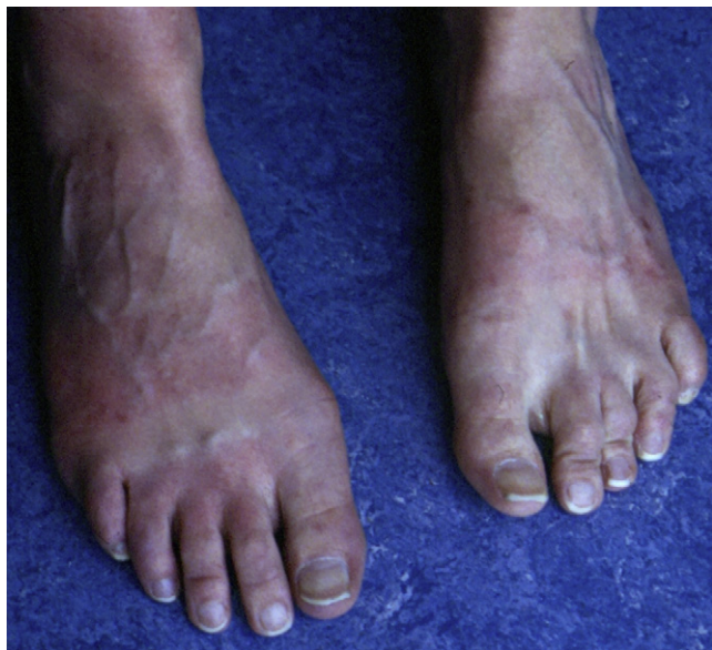
Figure 2. Lésions urticariennes du dos des pieds avec respect des zones couvertes par les sandales survenues lors d'un court trajet à pied l'été pour venir à la consultation.

L'évolution est chronique avec récurrence chaque été et peut durer plus de 20 ans [1,2]. L'urticaire solaire peut être très invalidante. Dans les formes sévères, le visage, le cou et les mains sont atteints en plus des zones habituellement couvertes empêchant par conséquent les activités exté-