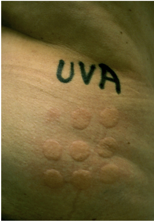
Figure 4. Évaluation de la dose urticarienne minimale (DUM) après exposition aux UVA à l'aide d'un simulateur solaire (Muller Elektronik) qui est calculé à 3 \text{ J/cm}^2 objectivée par la plus faible réaction du spot (en haut et à gauche sur la figure).

minimale (DEM), qui est la plus petite dose de lumière provoquant un érythème perceptible à contours nets, dont la lecture se fait à 24 heures, est normale.