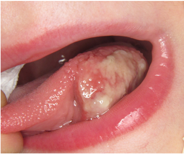
Figure 5. Ulcère éosinophilique lingual.

à l'origine de lésions des bords latéraux de la langue parfois inhomogènes. L'inspection de l'occlusion dentaire, des positions éventuelles et la palpation des cuspidés dentaires sont essentielles pour déterminer l'origine du traumatisme.