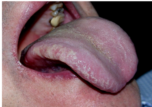
Figure 4. Tic de mordillement sur le bord latéral de la langue.