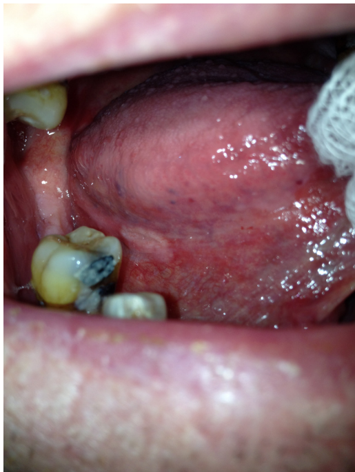
Figure 21. Carcinome épidermoïde débutant.