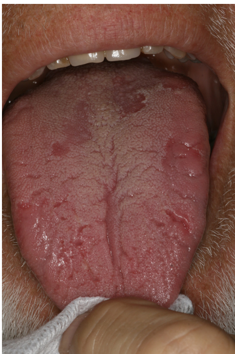
Figure 1. Aspect faussement ulcéré de la face dorsale de la langue (langue à la fois fissurée et géographique).

les ulcérations et les érosions restent un motif fréquent de consultation en dermatologie buccale.