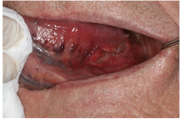
Figure 22. Carcinome épidermoïde, forme ulcéreuse.