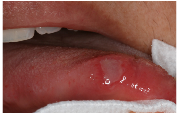
Figure 6. Aphte géant.

Les aphtes concernent 20 à 50% de la population, avec une prédilection pour le sujet de moins de 30 ans [9] présentant des antécédents familiaux ou personnels. L'ulcération est