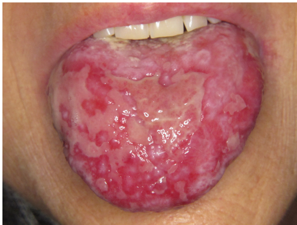
Figure 14. Lésions lichénoïdes ulcérées de GVHD chronique.