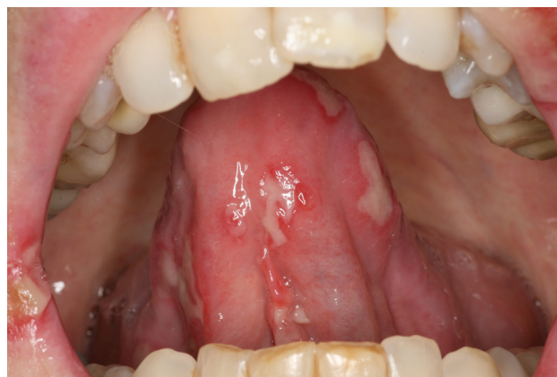
Figure 12. Mucite induite par chimiothérapie cytotoxique (aracytine).

bouche (prednisolone) permet d’améliorer les symptômes et le confort du patient. Une adaptation posologique peut être nécessaire pour les mucites de grades 3 et 4.