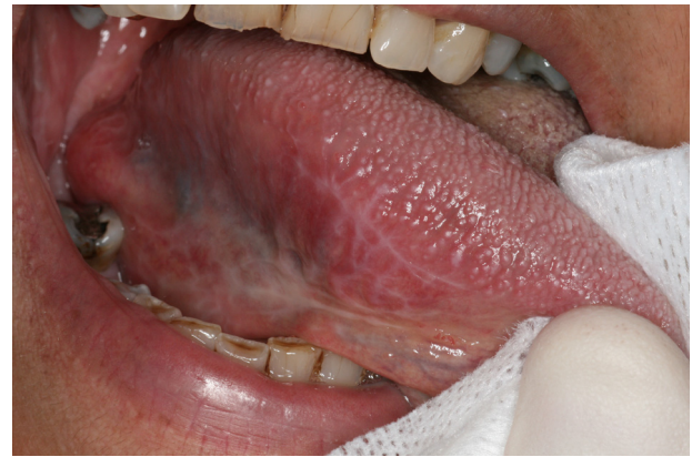
Figure 17. Lichen plan réticulé.

desquamative avec signe de la pince est pathognomonique [44]. Sur la langue, les lésions peuvent prendre la forme d'ulcérations post-bulleuses très douloureuses aux contours irréguliers, recouvertes d'un enduit pseudo-membraneux jaunâtre, entourées d'un halo inflammatoire [46].