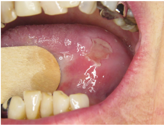
Figure 16. Ulcération post-bulleuse d'un pemphigus vulgaire.