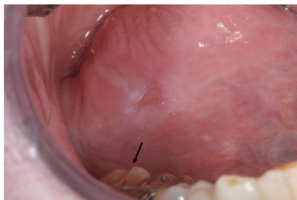
Figure 3. Ulcération traumatique avec cuspide dentaire en regard indiquée par la flèche ; noter le contour opalin péri-lésionnel caractéristique.