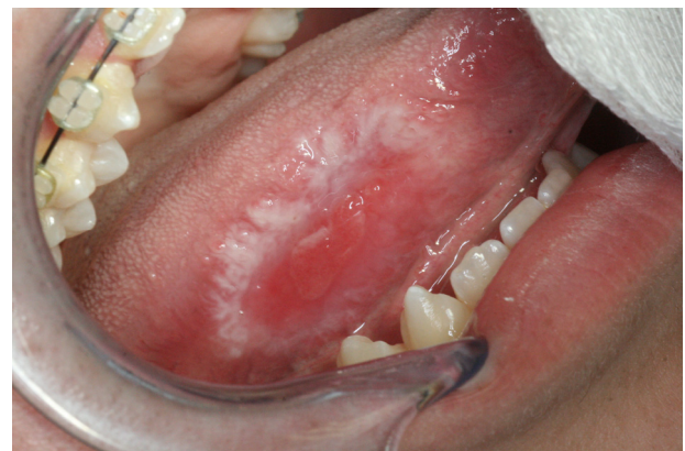
Figure 19. Lichen ulcéré avec contours réticulés.