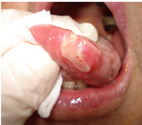
Figure 10. Ulcération médicamenteuse induite par le nicorandil.

après initiation du traitement [22]. Le développement de ces lésions est dose-dépendant [23], avec des ulcérations plus fréquentes au-delà de 30–40 mg/jour. L’usage de médicaments contenant du nicorandil a fait l’objet en 2012 d’une lettre d’information et de recommandations aux professionnels de santé par l’ANSM [24].