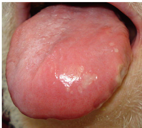
Figure 8. Lésions herpétiques mimant une aphtose miliaire.

L'aphtose complexe est le plus souvent idiopathique (aphtose complexe primaire) mais il faut éliminer systématiquement une étiologie associée (aphtose complexe secondaire): maladie de Behçet [15], mouth and genital ulcers with inflamed cartilage syndrome (MAGIC), syndrome de periodic fever aphthae pharyngitis adenitis (PFAPA), syndrome de Reiter (associé dans les formes aiguës à des lésions cutanéomuqueuses vésiculobulleuses), anomalies carencielles (zinc, vitamines B1, B2, B6, B9, B12, ferritine), une maladie inflammatoire chronique de l'intestin (maladie cœliaque, rectocolique hémorragique, maladie de Crohn),