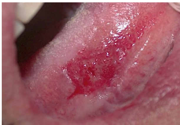
Figure 24. Érythroplasie.

rattachée à une autre pathologie [80,81]. Elle peut prendre un aspect ulcéro-érosif et concerner la langue. La prévalence est inférieure à 1 % et s'associe souvent à une dysplasie modérée ou sévère. Le potentiel de transformation maligne est élevé (14 à 50 %) [81] et une biopsie doit être systématiquement réalisée dans ce contexte.