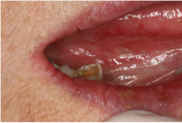
Figure 20. Ulcérations aphtoïdes dans le cadre d'un syndrome de Sweet.