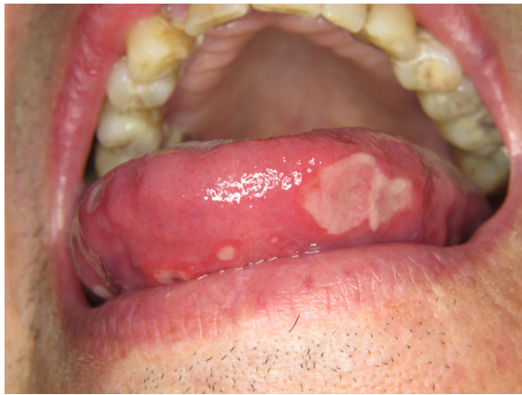
Figure 13. Ulcérations aphtoïdes induites par inhibiteur mTOR (temsirolimus).