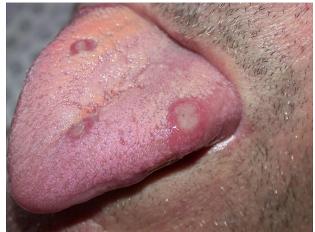
Figure 15. Ulcérations neutropéniques.