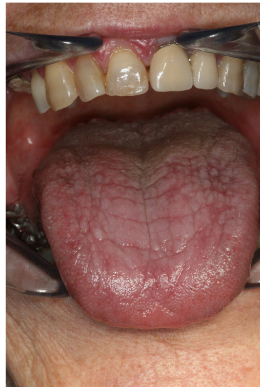
Figure 18. Lichen atrophique.

Le diagnostic est avant tout clinique dans les formes typiques mais nécessite parfois une caractérisation histologique en cas de doute [47]. Une surveillance à long terme [47,51] est justifiée, le risque de transformation maligne étant estimé entre 0,4 et 5%. Cela concerne surtout les formes chroniques atrophiques ou ulcérées mais une biopsie doit être systématiquement réalisée devant toute lésion atypique, persistante ou cliniquement suspecte.