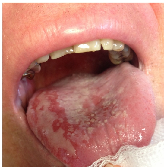
Figure 11. Mucite induite par radiothérapie externe.

Elle correspond à l’inflammation de la muqueuse buccale induite par la radiothérapie externe (Fig. 11) (à partir de 30 grays) et/ou la chimiothérapie. Les mucites concernent près d’un patient traité sur deux. Ces lésions, aux contours mal délimités, plus ou moins extensives, ulcérées, à fond fibrineux, avec pseudo-membranes développées sur un fond érythémateux, sont douloureuses et altèrent fréquemment la qualité de vie des patients. Les lésions induites par la chimiothérapie (Fig. 12) sont strictement localisées sur la muqueuse non kératinisée, contrairement aux lésions radio-induites qui peuvent s’étendre également à la muqueuse kératinisée. Les traitements préventif et curatif ne sont pas standardisés et n’ont pas fait l’objet de beaucoup de travaux prospectifs [29,30]. Une prise en charge buccodentaire régulière en milieu spécialisé associée à des soins locaux adaptés (brossages muqueux et dentaire suivis de bains de bouche sans chlorhexidine et alcalins) doit être préconisée afin de limiter l’inflammation de la muqueuse buccale et prévenir l’intensité de la mucite [31]. Dans notre expérience clinique, l’utilisation combinée d’antalgiques systémiques, de séances de laser basse énergie (630–670 nm) [32] associées à l’application locale d’un dermocorticoïde très fort (clobetasol propionate) et/ou d’une corticothérapie en bain de