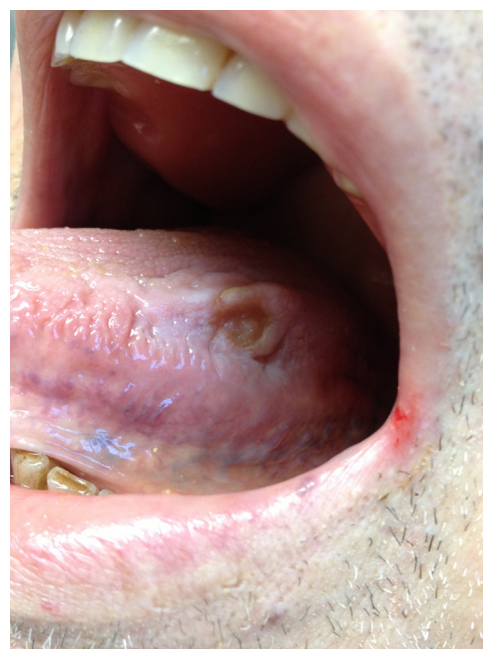
Figure 2. Ulcération traumatique secondaire à une morsure itérative.

Elles représentent l'étiologie la plus fréquente des ulcérations orales. La cavité buccale est le siège de nombreux micro-traumatismes (cuspide dentaire acérée, morsure [Fig. 2], prothèses...) en lien avec les fonctions orales et certaines para-fonctions (bruxisme, serrement, succion). L'ulcération adopte le relief de l'agent responsable et le bord est fréquemment opalin (Fig. 3), témoin d'une kératose frictionnelle. Le tic de mordillement (Fig. 4) est également