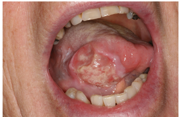
Figure 23. Carcinome épidermoïde, forme ulcéro-végétante.

Deux tiers des cancers de la cavité buccale se situent sur la langue [72], préférentiellement sur les bords latéraux, à la jonction du 1/3 postérieur et des 2/3 antérieurs de la langue mobile ou sur la face ventrale. La face dorsale est plus rarement concernée [72]. Quatre-vingt-dix pour cent des cancers de la cavité buccale sont des carcinomes épidermoïdes. Les facteurs de risque principaux sont l'alcool et le tabac mais l'incidence des cancers en lien avec une infection chronique à HPV est également en nette augmentation [73–76]. Ces derniers se localisent avant tout au niveau de la base de la langue et en région amygdalienne. Étant