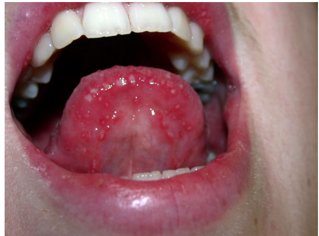
Figure 7. Aptose herpétiforme ou miliaire.

ronde ou ovale [10–13], bien délimitée, à fond fibrineux (ou beurre frais), entourée d'un halo inflammatoire érythémateux. Elle se localise en général sur la muqueuse non kératinisée incluant la face interne des joues, le plancher buccal, le palais mou, la muqueuse labiale ainsi que les faces latérales et ventrale de la langue [9,10,13] et siège exceptionnellement sur la muqueuse kératinisée (face dorsale de la langue, gencive, palais dur) [10,13]. La cicatrisation se produit entre 4 et 14 jours mais peut être beaucoup plus longue en cas de lésion de grande taille.